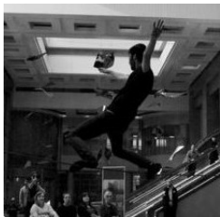
Hamlet sur le fil